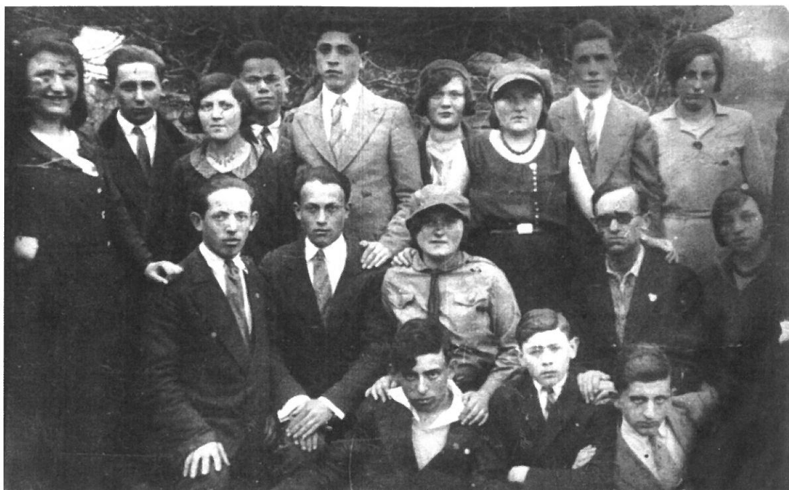
1932 - חברי "החלוץ"