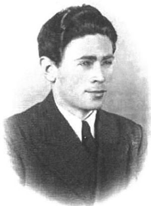
1944 - בהונגריה