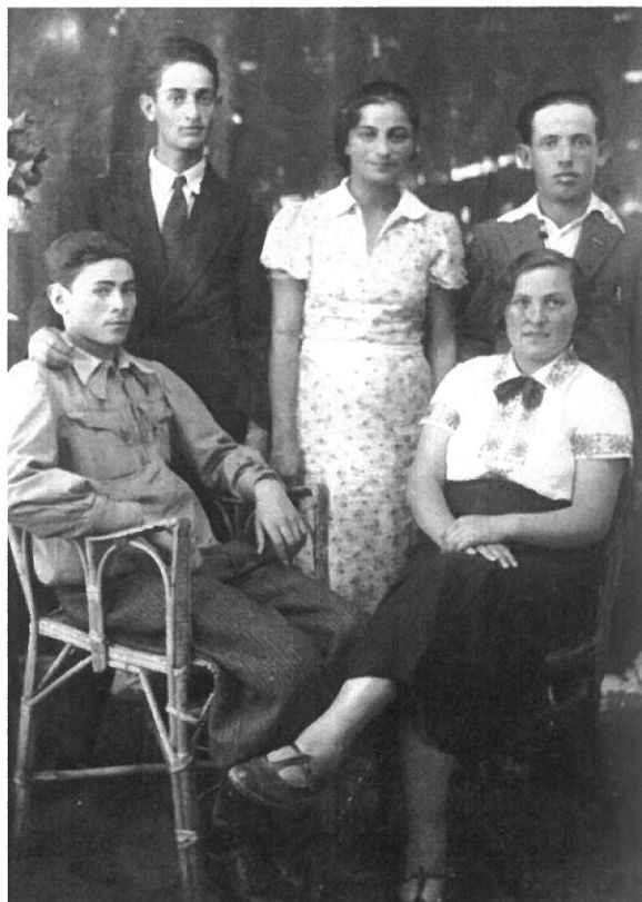
▶ 1933 - ועד "החלוץ"