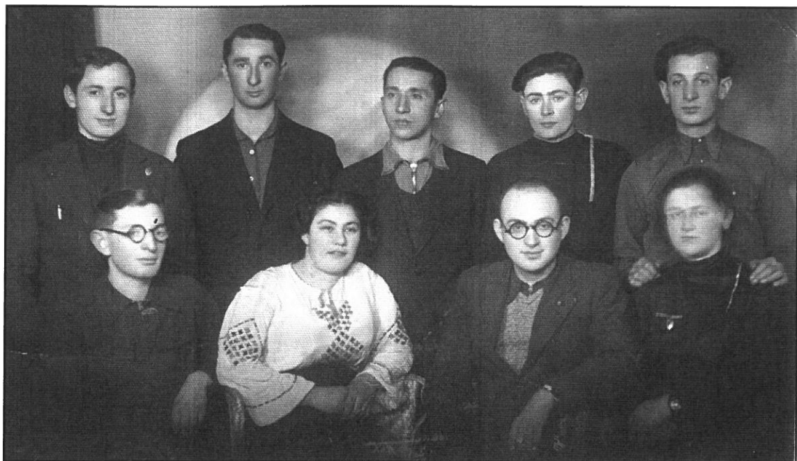
ינואר 1938 - בקיבוץ בעיר בנדין