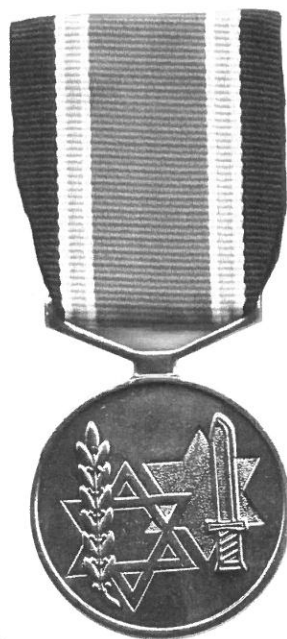
אות הלוחם בנאצים ותיק מלחמת העולם השנייה