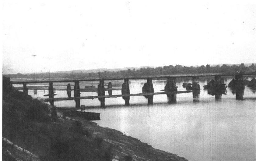
הגשר הישן על הויסלה ▲ ליד ראחוב